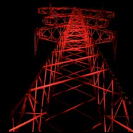
Hoogspanningsmasten verbeelden de energiestroom naar Eindhoven.

Een van de laatste projecten die hij met zijn vijf medewerkers aanpakte, is de donkere ruimtes onder de Traverse in Helmond. „In de winter laat ik het er sneeuwen en in de herfst vallen er blaadjes. De donkere onveilige ruimte is nu zichtbaar en vriendelijker geworden.” In de kantine van zijn bedrijf draait hij aan enkele knopjes. Van ijsblauw verkleurt het plafond naar zomerrood. „Afhankelijk van de weersomstandigheden en de werkdruk passen we hier de sfeer aan. Goed hè?”