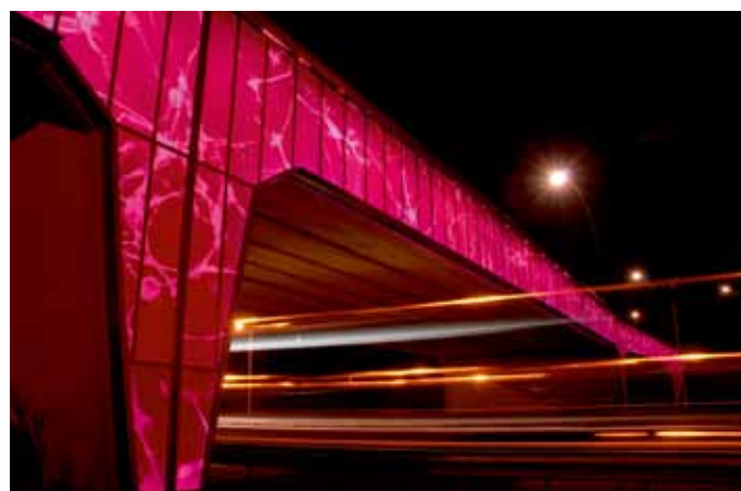
Viaduct over de A2/A67 bij de High Tech Campus in Eindhoven.