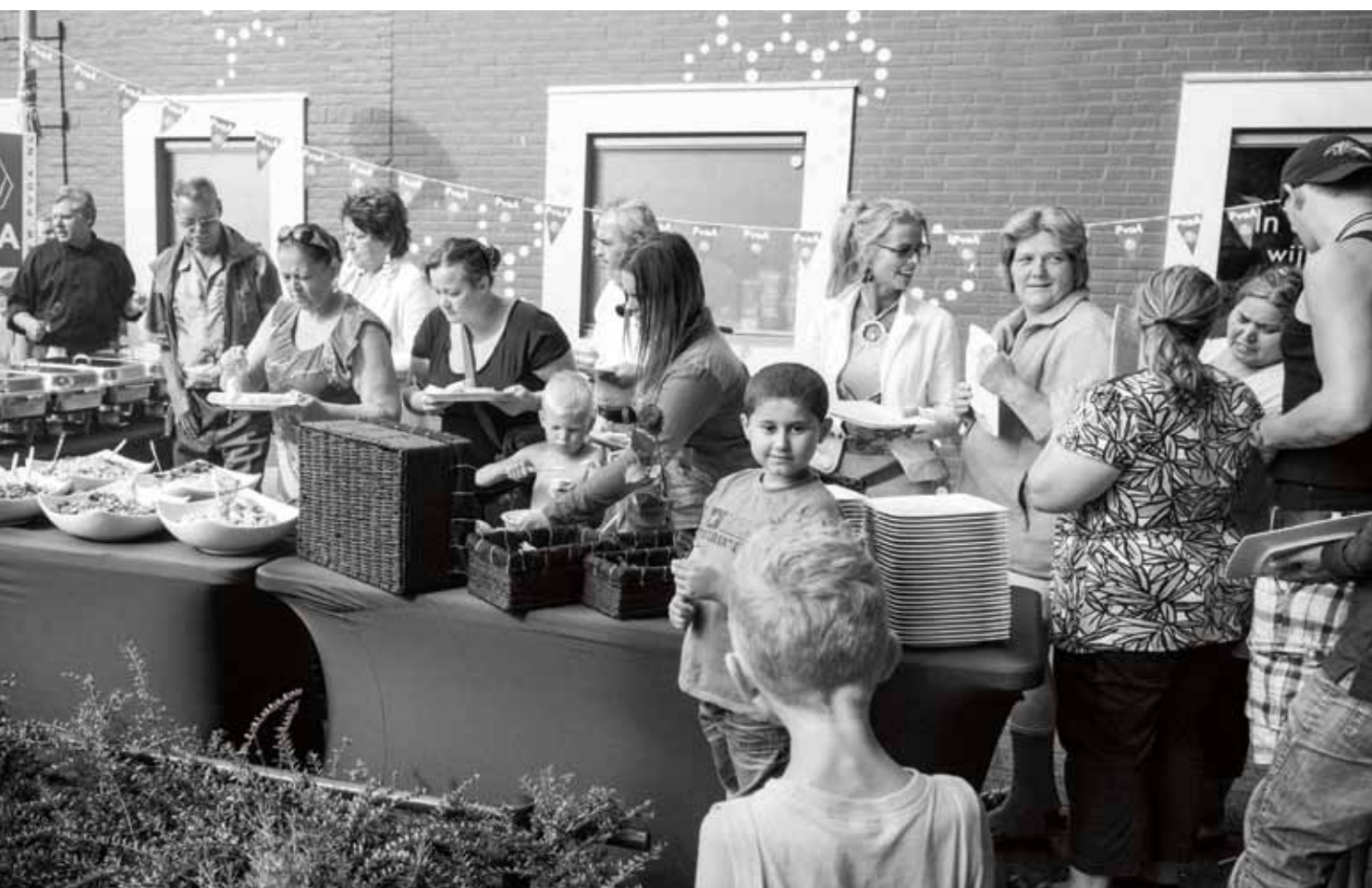
Buurtbarbecue van de PvdA bij buurtrestaurant In de Voortuin in Woensel-West.

„Thuis werd er vroeger veel over politiek gediscussieerd. De les die wij hebben gekregen is dat we niet alleen voor onszelf leven. Ons moeten realiseren dat niet iedereen het goed heeft. Diep van binnen heb ik de ontsluitbare drang om iets te doen tegen onrecht. Toen ik net PvdA-lid was, kwam ik een oudere dame