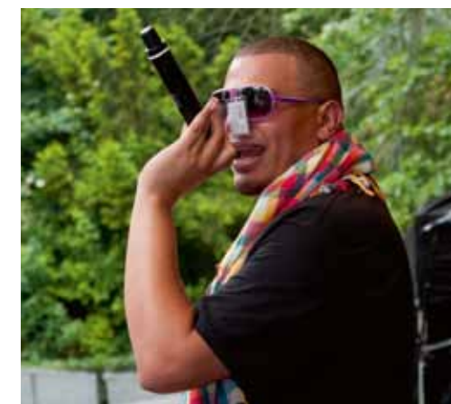
Fresku zingt het nummer 'Op de hoogte'.