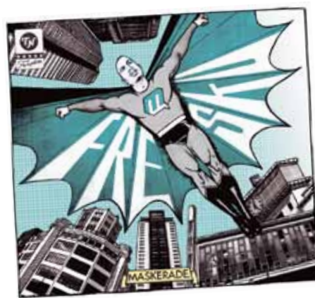
Fresku's tweede album 'Maskerade'.

In de auto naar België. Later vanmiddag moet Roy optreden op een hip-hop-festival net iets buiten Antwerpen. Daarna door naar Amsterdam voor een show in de Melkweg. Ik zit