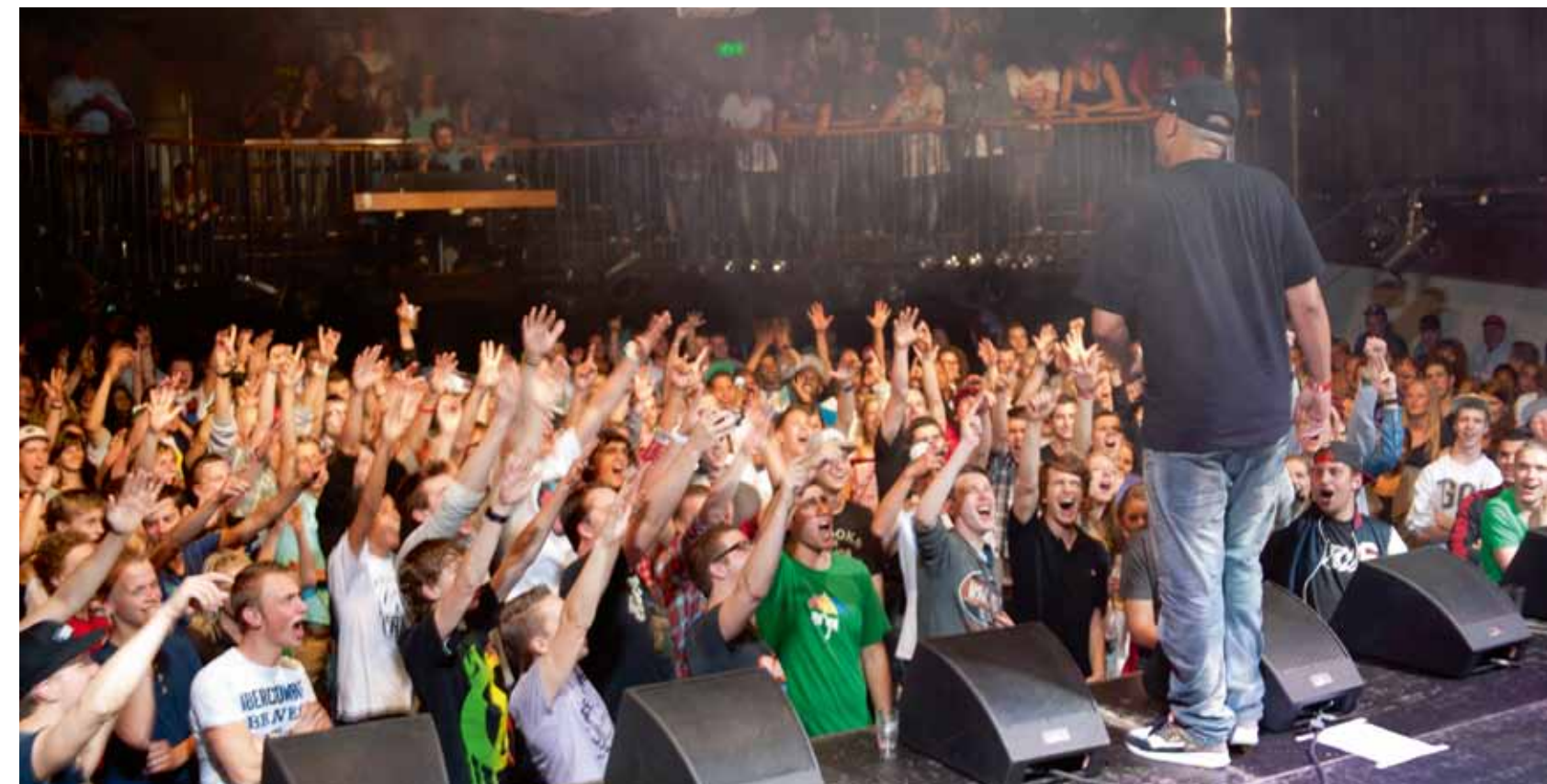
Fresku tijdens het optreden in de Melkweg.