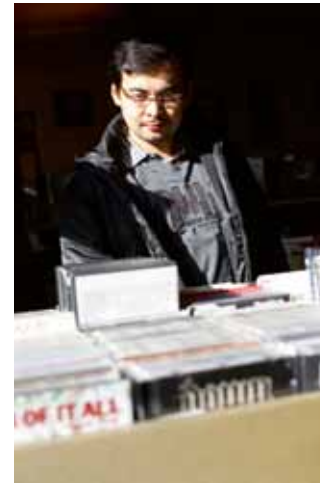
De voormalige CD-theek op de Kleine Berg.