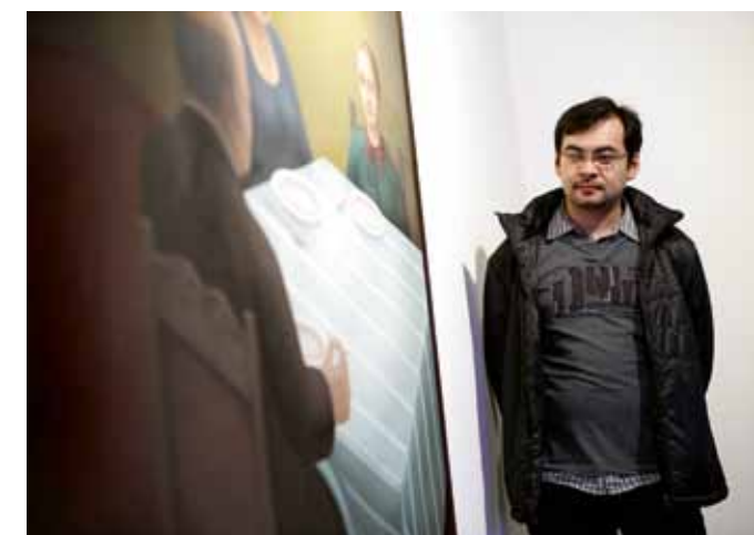
Optische illusies in Centrum Kunstlicht in de Kunst