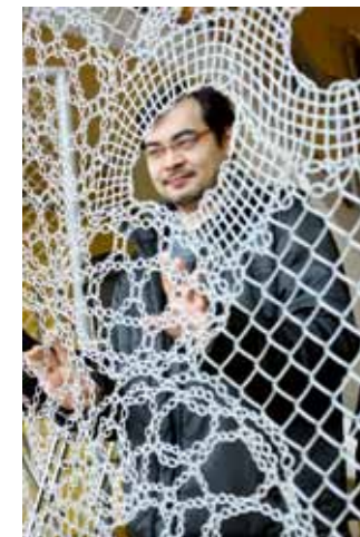
in het Effenaar café en backstage op de tweede etage.