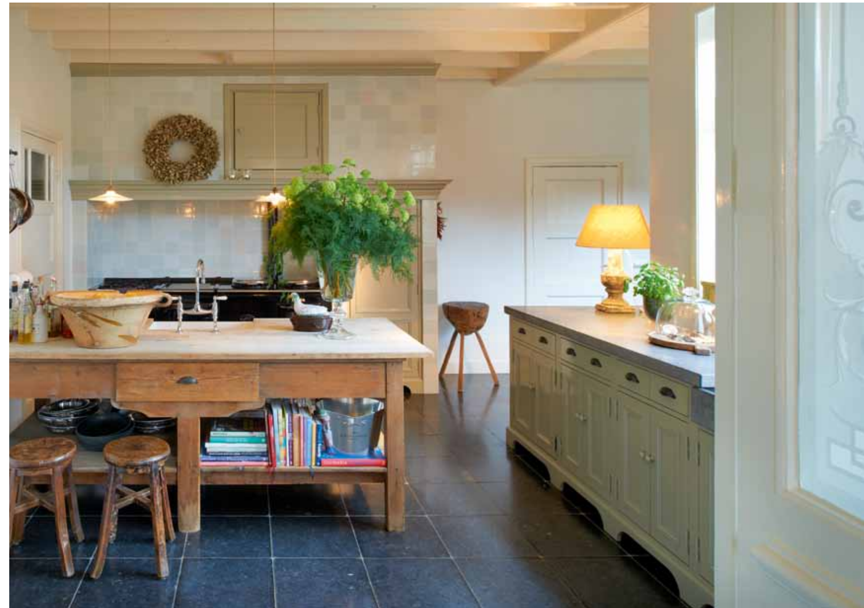
De keuken met op de achtergrond nog zichtbaar: de Aga.

boerderij in het buitengebied erbij gekocht.”